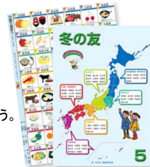
※5年の表紙、付録が変わりました。

希望購入の学校で、担当の先生がテレビ放送で全校に紹介したり、見本本を子供たちが自由に見ることができるよう展示したりしたところ、『冬の友』を活用する子供が増えました。いろいろ工夫して紹介していただけるようお願いいたします。