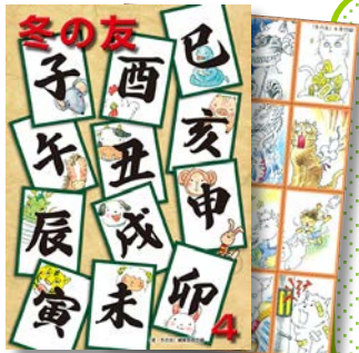
※4年の表紙、付録が変わりました。